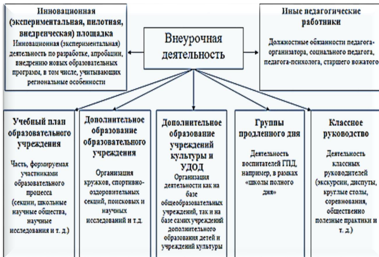
Рис. 1. Базовая организационная модель реализации внеурочной деятельности

созданий условия для профессионального самоопределения обучающихся (рис. 1).